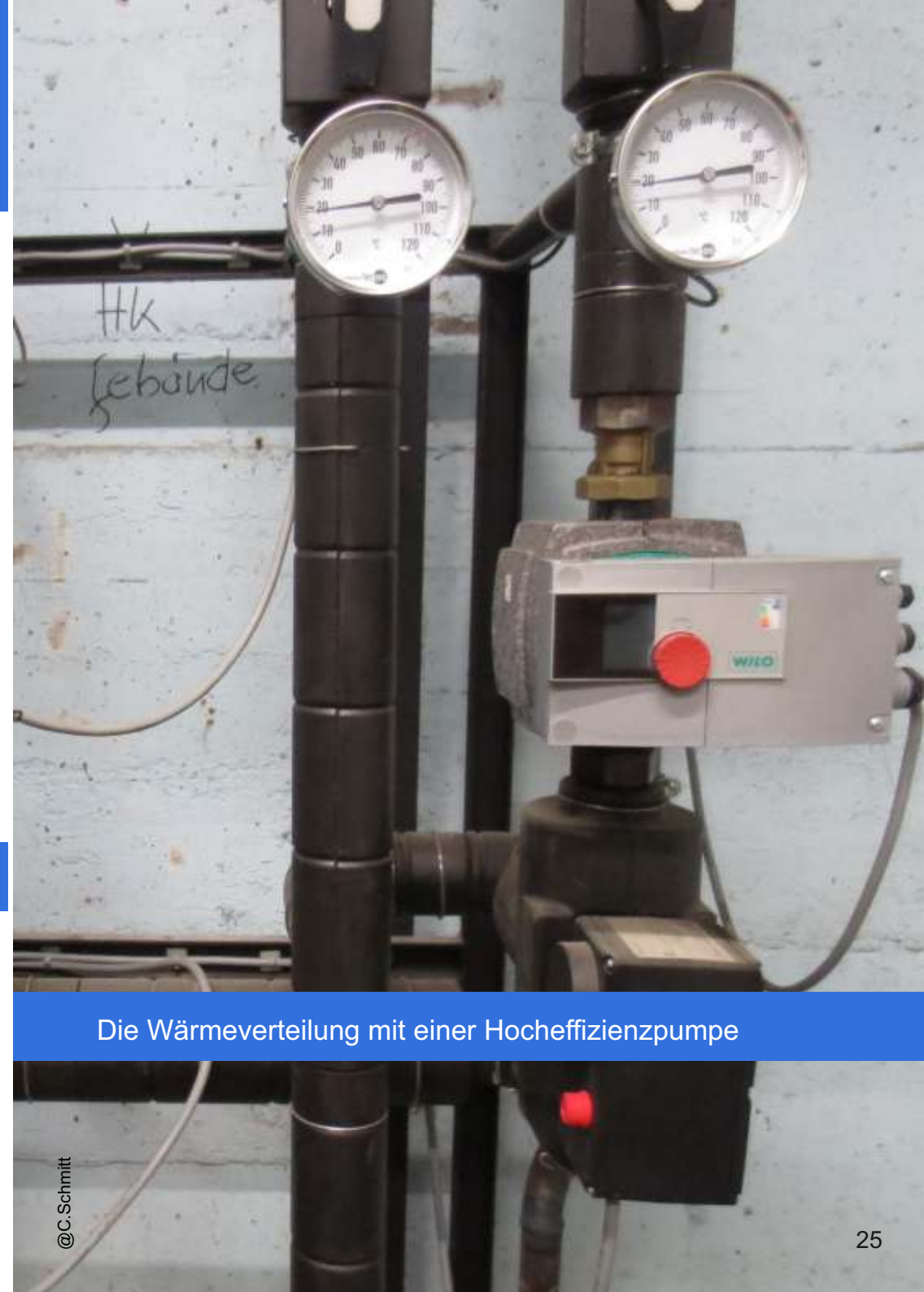
Die Wärmeverteilung mit einer Hocheffizienzpumpe

2012 wurden die in die Jahre gekommenen Erdgas-Heizkessel mit einer Fernwärmestation ersetzt. Die Abwärme aus der Stromproduktion in den Mannheimer Kohle-Großkraftwerken wird so genutzt, was für eine optimale Ausnutzung der Brennstoffe sorgt. In diesem Fall ein effizienter Kompromiss. Eine Fernwärmanlage ist nahezu wartungsfrei und kann platzsparend installiert werden.